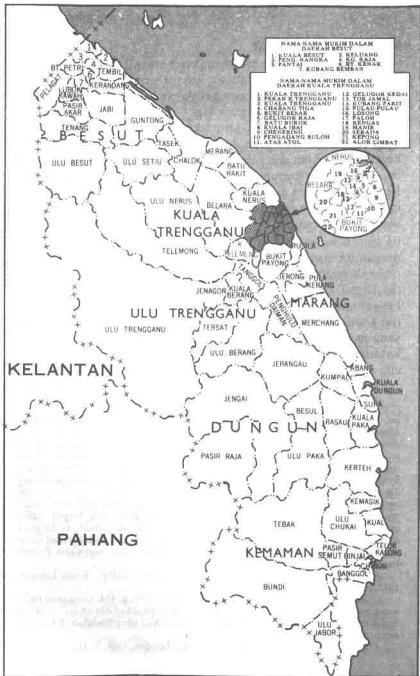
TRENGGANU: DAERAH DAN MUKIM (Sumber: Atlas Kebangsaan Malaysia, 1977)