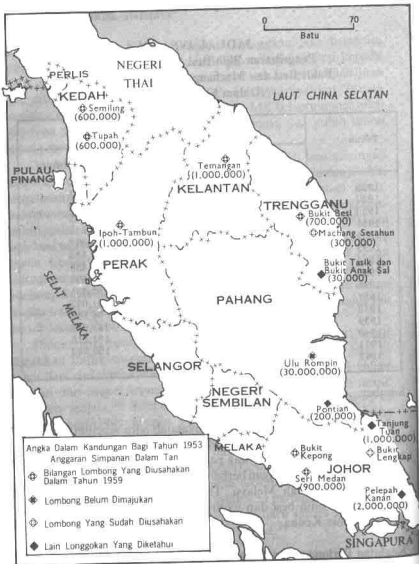
MALAYSIA BARAT: TABURAN KAWASAN LOMBONG BIJIH BESI PADA TAHUN 1959